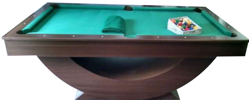
MESA 4 EN 1 BILLAR