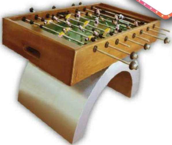
TRADICIONAL ARCO INVERTIDO