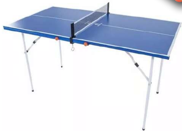
MESA DE PIN-PON