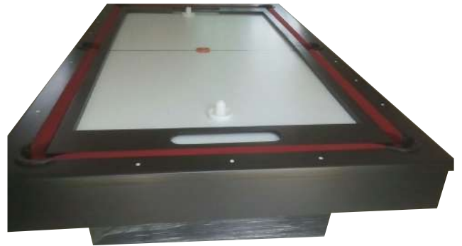
HOCKEY MESA 4 EN 1