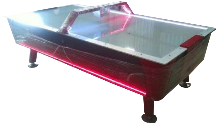
MESA DE HOCKEY CON LUZ LED