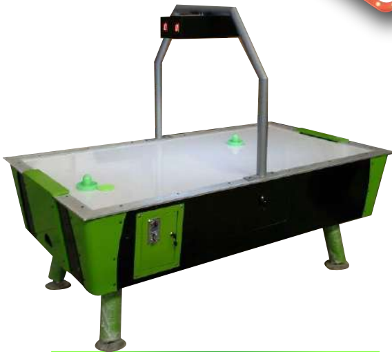
MESA DE HOCKEY NORMAL