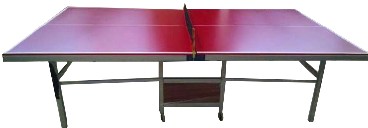
MESA DE PIN-PON