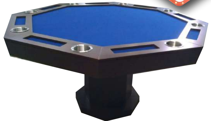
MESA DE LOTERIA